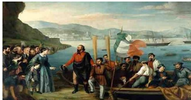
Garibaldi ritratto di fronte al suo ambiente naturale

lia nuova. Milano era insorta, gli austriaci in fuga, tutta l'Italia in armi. Sbarcato a Nizza, Garibaldi venne accolto da folle festanti. Ottenne il numero di matricola 12946, del registro della gente di mare di Genova e la patente di capitano di prima classe, con cui poté continuare la pratica marinai, ma soprattutto fu pronto per l'ultima grande impresa marinara che nel maggio del 1860, da Quarto (GE), lo portò con mille uomini audaci a Marsala, in Sicilia, sui piroscafi Piemonte e il Lombardo .