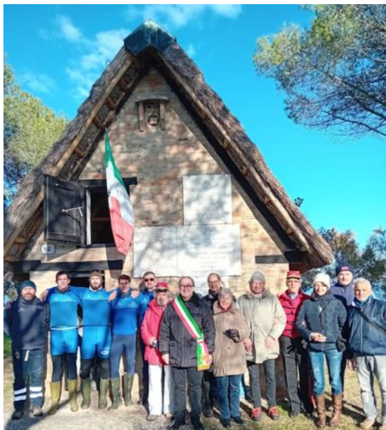
Atleti e dirigenti della Società Canottieri Ravenna

Celebra 150° dalla fondazione, avvenuta nel 1873