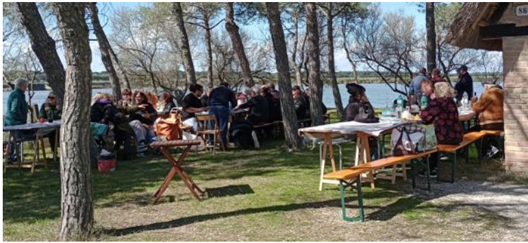
San Giuseppe 2024 al Capanno Garibaldi

CONCLUSIONI - Il capanno, immerso nell'ambiente naturale della valle, tra acqua e pineta, un luogo isolato ed impervio fra vecchi canali, tanto da essere scelto dai patrioti come sicuro rifugio per il Generale durante la trafila, è diventato un monumento simbolo della storia nazionale. Il Capanno è il tipico esempio di capanno da caccia degli ambienti palustri ravennati e pur essendo ai margini della pineta, ne è parte integrante. La Società Conservatrice del Capanno Garibaldi, sin dal 1882, è impegnata nella sua conservazione per trasmettere alle future generazioni la memoria degli avvenimenti risorgimentali che qui si sono svolti.