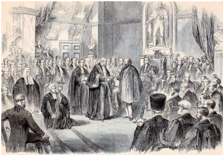
L'Arrivo di Garibaldi in Inghilterra

Nel ricevimento offerto dal duca di Sutherland incontrò il liberale John Temple Palmerston che all'epoca della spedizione dei Mille aveva convinto il governo inglese a schierare le navi inglesi nel Mediterraneo favorendo lo sbarco delle Camice Rosse. In gioco c'era il monopolio inglese dello zolfo siciliano e secondo Palmerston l'impresa garibaldina avrebbe rafforzato la